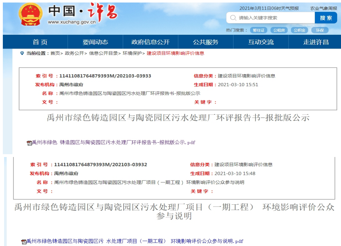
图 5 项目报批前网络公示截图