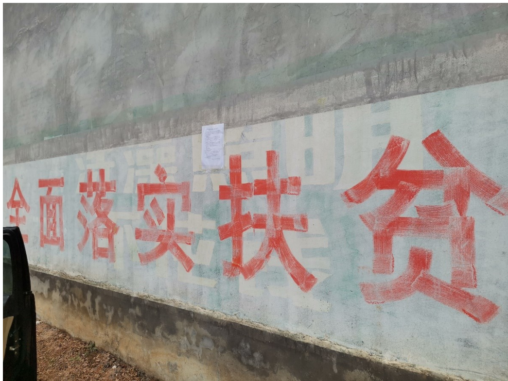
图3.2-4.3 现场公示照片（山前徐庄村）