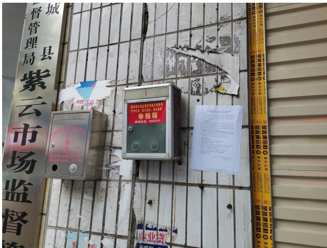
图3.2-4.4 现场公示照片（紫云镇）