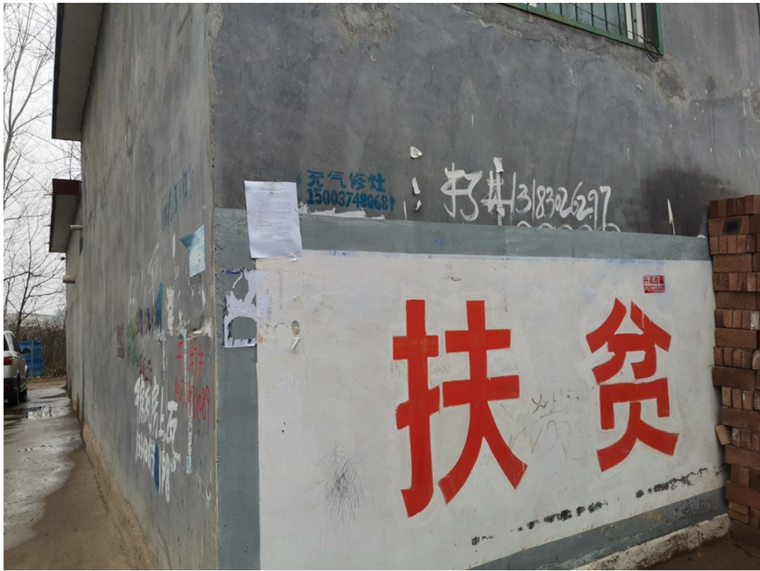
图3.2-4.5 现场公示照片（东朱庄）