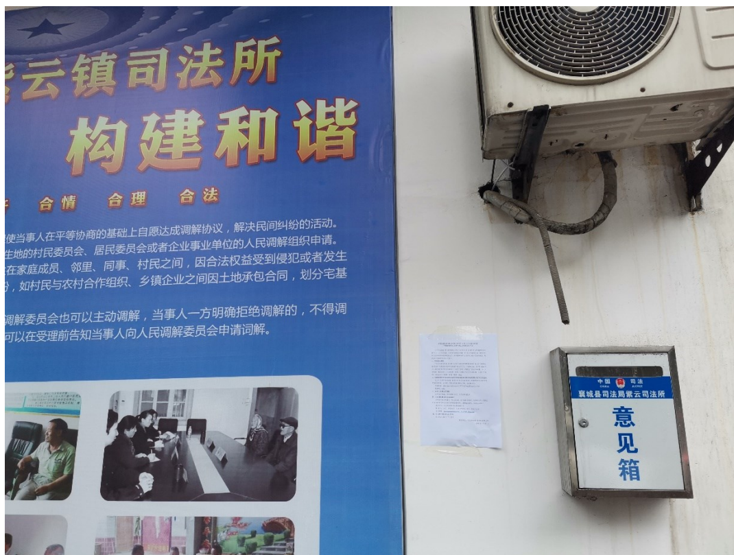
图3.2-4.5 现场公示照片（紫云镇）