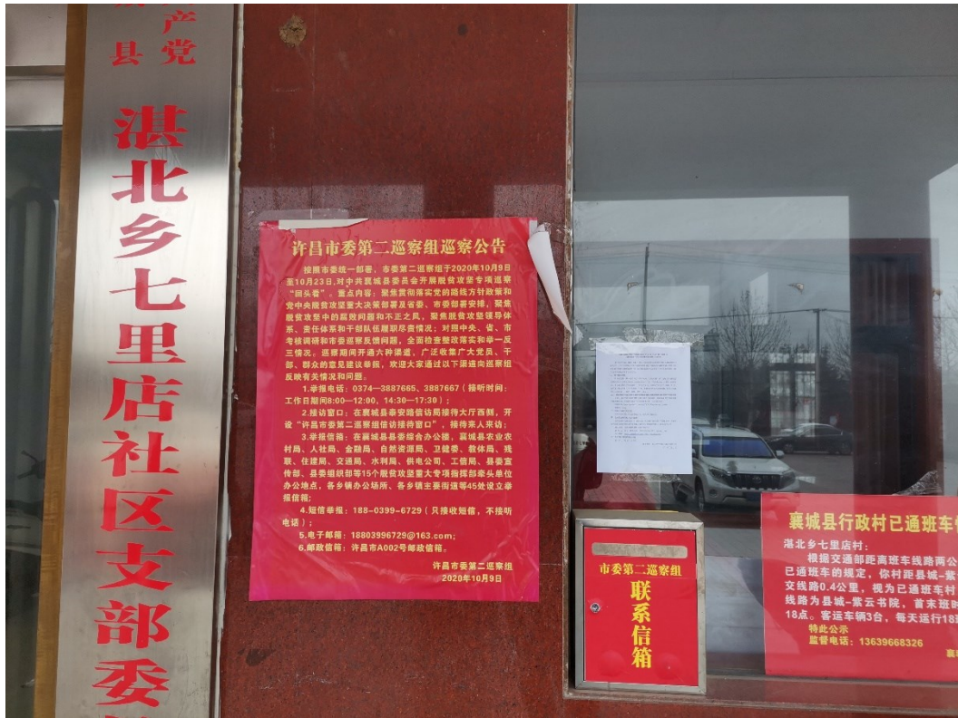
图3.2-4.2 现场公示照片（七里店）