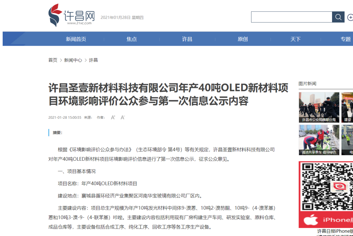
图2.2-1 项目首次公示截图

在建设项目所在地网络平台许昌日报社网站-许昌网进行网上公示，公示网址： http://www.21xc.com/content/202101/28/c476252.html ，公示时间为2021年1月28日，项目首次公示截图见图2.2-1。