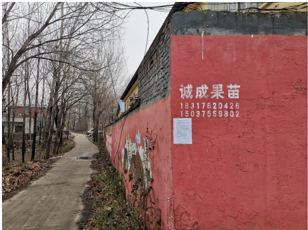
图3.2-4.6 现场公示照片（侯坟）