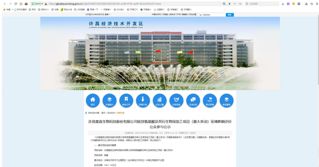
图1 公众参与信息公示在国家许昌经济技术开发区政府网站公示图片