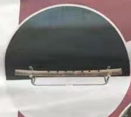
镇院之宝之一 云纹铜禁