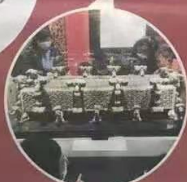
镇院之宝之一 贾湖骨笛