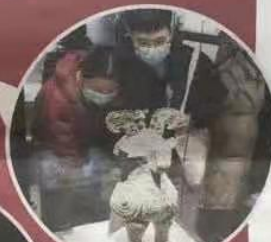
镇院之宝之一 贾湖骨笛