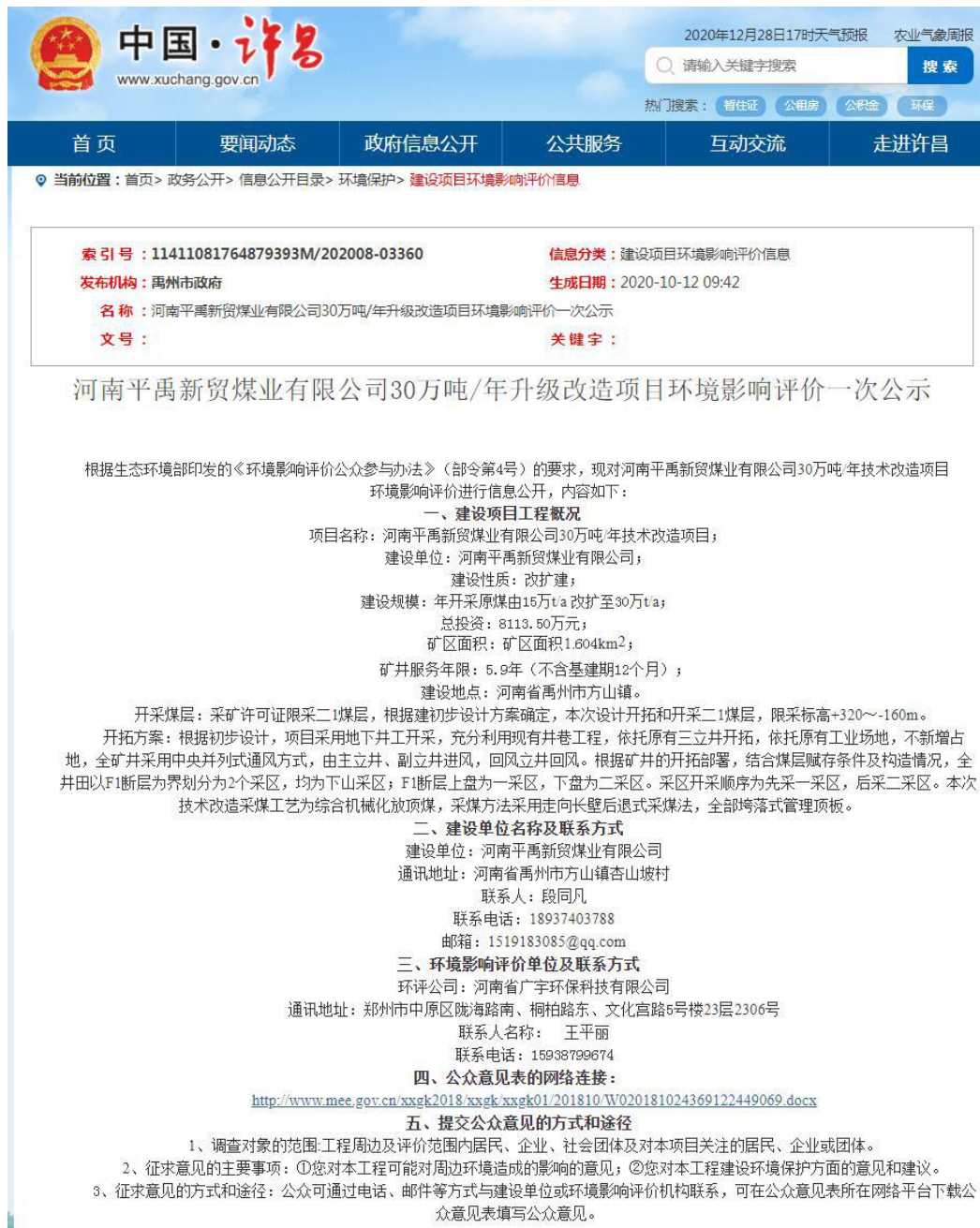
图 2 第一次网络公示截图