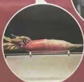
镇院之宝之一 贾湖骨笛