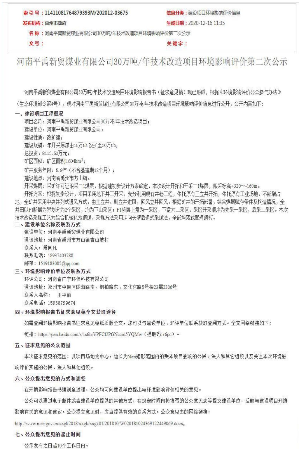
图5 第二次网络公示截图

2020年12月16日在许昌市政府网站进行了第二次网络公示： http://www.xuchang.gov.cn/openDetailDynamic.html?infoId=00cad79e-7596-4d27-9c1e-cc40c04d99dd 为第二次网络公示链接。第二次网络公示截图见图5。