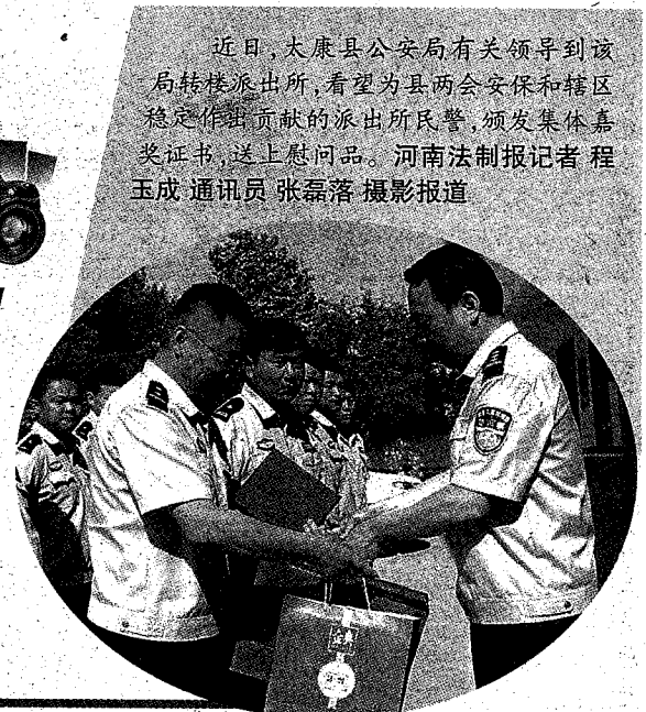
近日,大康县公安局有关领导到该局转楼派出所,看望为县两会安保和辖区稳定作出贡献的派出所民警,颁发集体嘉奖证书,送上慰问品。