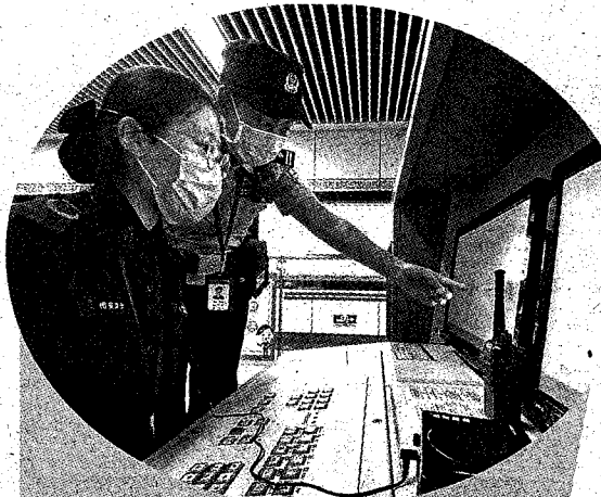
近日,为确保辖区物流寄递行业规范生产经营,郑州市公安局经济技术开发区分局祥云派出所组织民警,对辖区物流园区各快递公司进行安全检查。

要加强社区文明建设,营造良好的治理氛围。通过义务劳动、法律宣传、治安防范等形式,带领和引导社区党员群众参与社区建设的积极性主动性,提高居民的参与度,把社区建设得更加宜居、更加和谐、更加美丽。