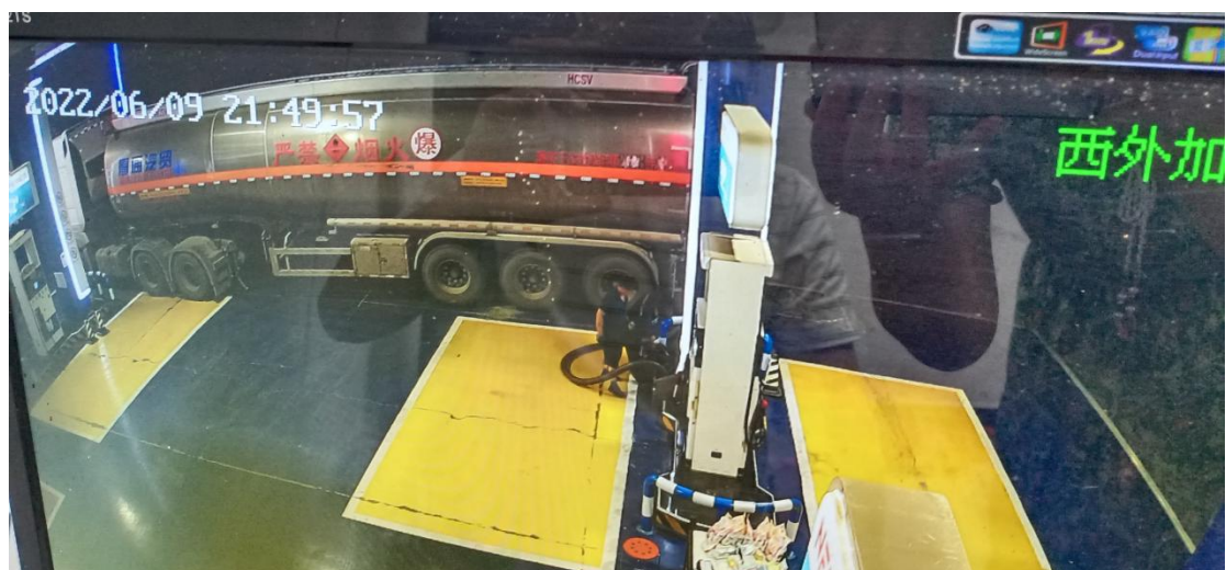
执法人员调取卸油视频监控