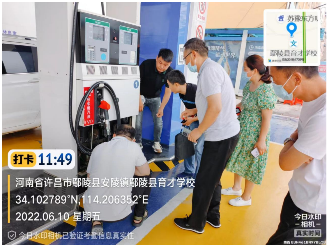
执法人员使用PID检测仪现场检查